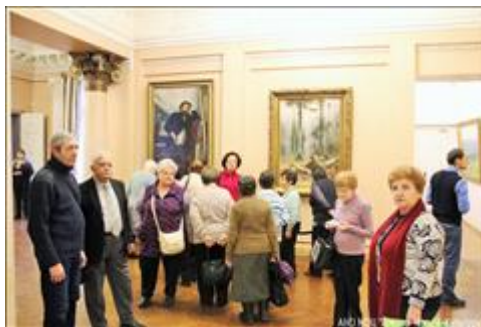
26.11.18. Самара, ул. Куйбышева, 92. Экскурсия по художественному музею ("серебряные" добровольцы)