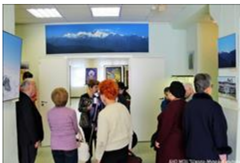
12.10.18. Самара, ул. Мичурина, 23. Экскурсия по выставочному центру "Радуга" ("серебряные" добровольцы) 12.10.18. Самара, ул. Мичурина, 23. Экскурсия по выставочному центру "Радуга" ("серебряные" добровольцы)