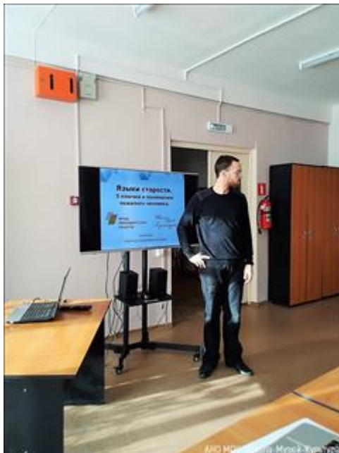
27.11.18 Октябрьск, ул. Ленинградская, 48, центр общественного доступа (Титков И.С.) 27.11.18 Октябрьск, ул. Ленинградская, 48, центр общественного доступа (Титков И.С.)

Количество публикаций за весь срок осуществления проекта