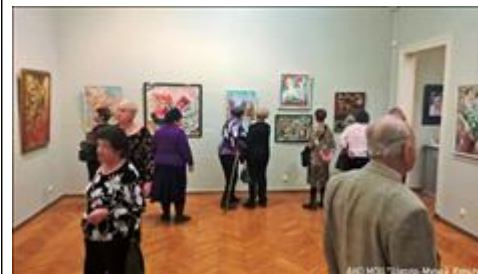
14.11.18. Самара, ул. Куйбышева, 92. Экскурсия по художественному музею ("серебряные" добровольцы) 14.11.18. Самара, ул. Куйбышева, 92. Экскурсия по художественному музею ("серебряные" добровольцы)